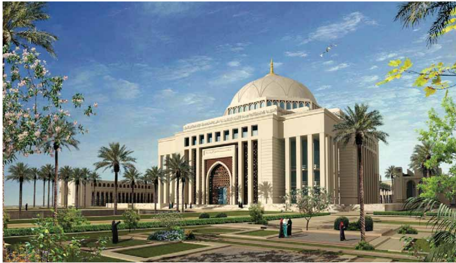
جامعة الأميرة نورة، الرياض: أكبر جامعة للطالبات في العالم

للطلاب، حيث افتتح العديد من منشآت التعليم العالي الأهلية بكافة الفئات والتخصصات في معظم مناطق المملكة الرئيسية، التي بلغ عددها تسع جامعات أهلية، وأكثر من خمسة وثلاثين كلية.