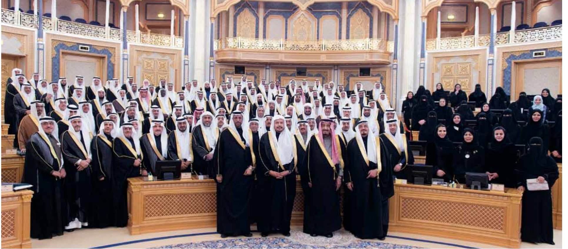
أعضاء وعضوات مجلس الشورى في لقطة جماعية مع خادم الحرمين الشريفين الملك سلمان بن عبد العزيز آل سعود