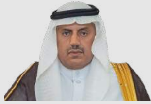
أ.د. فالح بن رجاء الله السلمي رئيس الجامعة